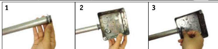
Lắp tân ren trong