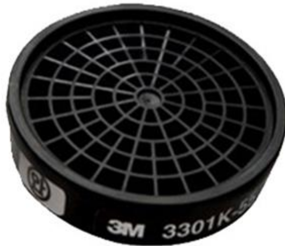
Phin lọc hơi hữu cơ 3M 3301K-55

Mặt nạ nửa mặt dòng 3M 3200 được sử dụng kèm với các loại tấm lọc và nắp giữ, giúp bảo vệ hô hấp người lao động trong môi trường làm việc có bụi hàn, khói hàn, hơi hữu cơ dùng nhiều trong quá trình hàn cắt, chế tác kim loại, gỗ...Loại mặt nạ nửa mặt dòng 3200 thường được sử dụng kết hợp với các phin lọc 3M 3301K-100, phin lọc 3M 3301K-55, tấm lọc 3M 3744K