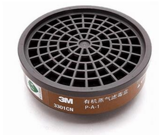
Phin lọc 3M 3301K-100